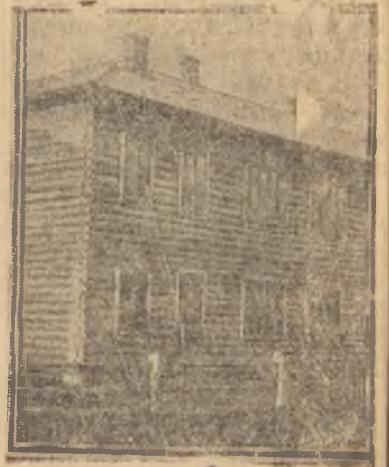
Новый дом рабочего поселка.