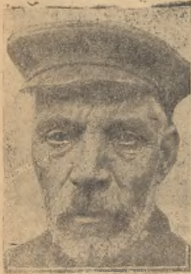
Лучший старый ударник токарного цеха Подморин—один из организаторов Октябрьского поселка.

В те времена, когда новые люди взялись за стройку, только что отгремели раскаты гражданской войны. Страна залечивала раны и так был молод первый строительный зуд создателей нового общественного строя, что на месте рабочего поселка, носящего сейчас название «Октябрьский» в 1923 году ничего не было.