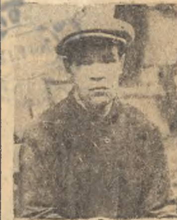
Ударник литейного Моковеев.

превращает каждого трудящегося в активного строителя социализма.